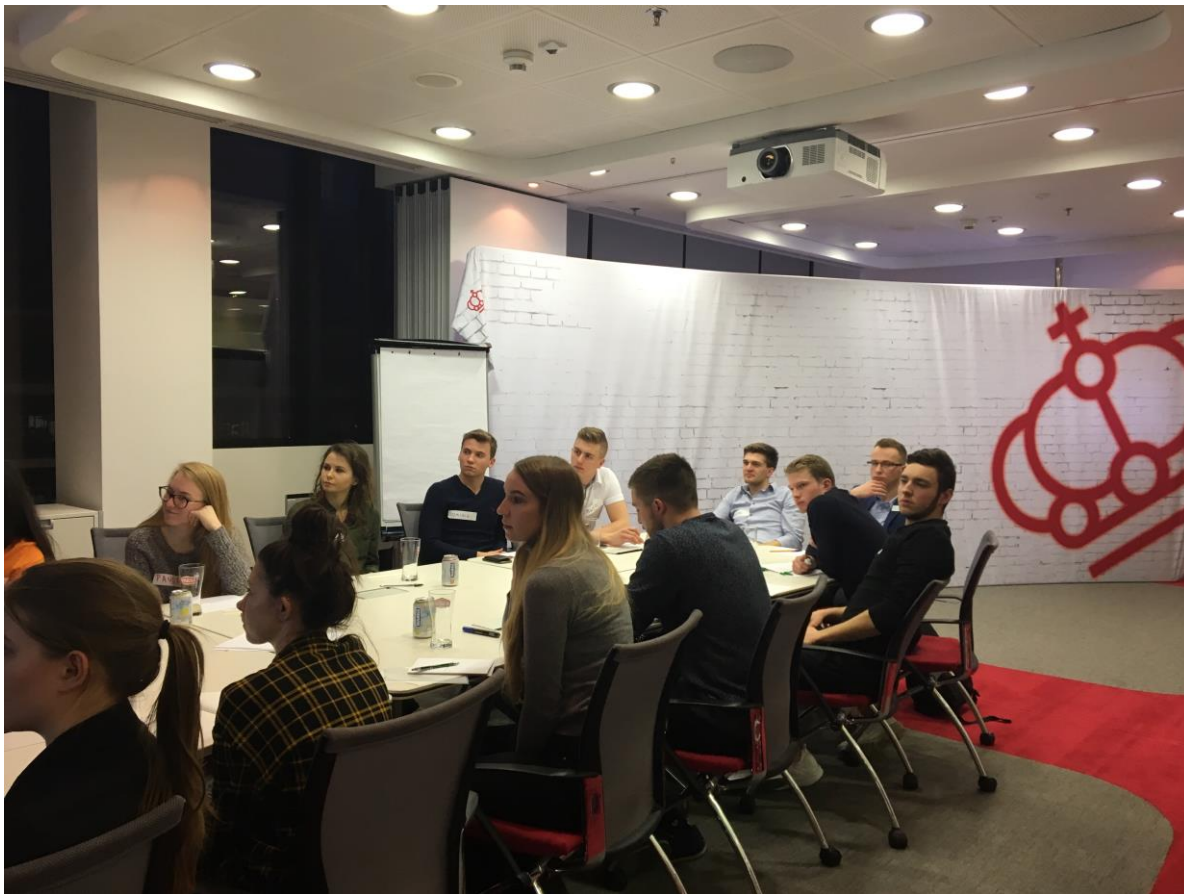
warsztaty dla studentów