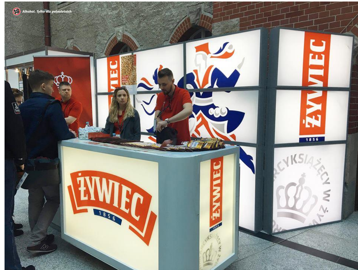
uczestnictwo w wybranych Targach Pracy